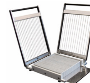
CHITARRA - DOPPIA